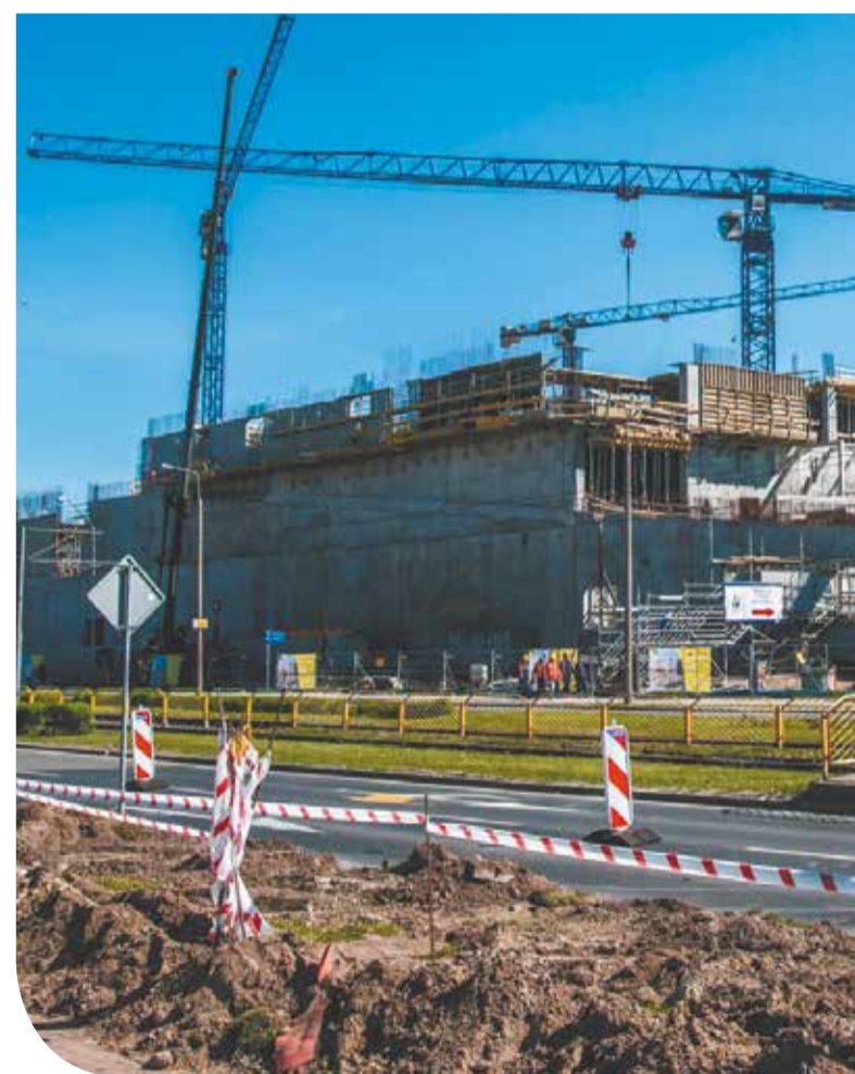
Prace budowlane w CH Ogrody

maieu, Sizer, Rossmann, Home&You, McDonald's, Lavard, Apart, Ziaja, budowy Galerii. Niebawem rozpoczyna się również prace wewnątrz budynku związane z montażem centrali wentylacyjnych oraz chodników ruchomych.