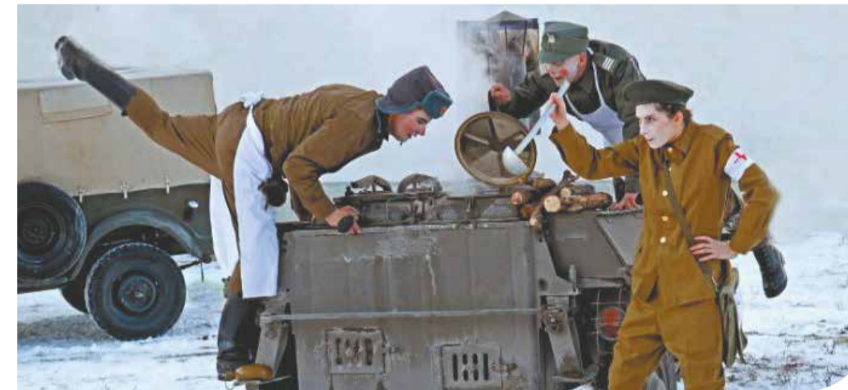
Kadr z przedstawienia

„władza rozumu przekształca dla człowieka świat w piekło za życia”. Jesteśmy zagubieni i ciągle doskwiera człowiekowi poczucie bytowania. Spektakl to unaooczenie tych słów przedstawione w dość zaskakującej formie. W takim świecie trudno żyć, tworzyć i pracować. Jednak ciągle walki ostacnie ze słabości czynią siłę. Efekt przedstawienia dodatkowo potęgowa-