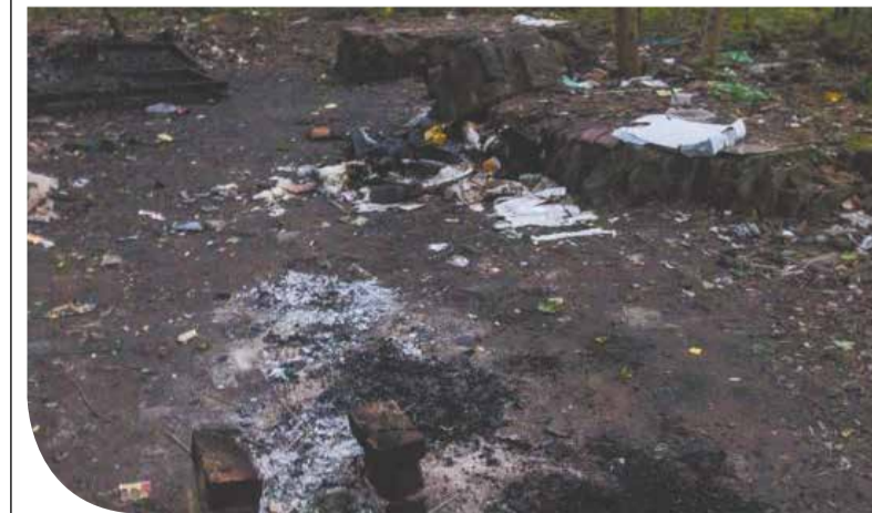
Koczowisko bezdomnych

wreszcie dotrzeć do „noclegowni”. Na miejscu rzuca się w oczy przede wszystkim duży śmietnik. Wokół leżą kartony, puszki po piwie, pobite szklane butelki. Da się zauważyć kilka miejsc „wyleżanych” - prawdopodobnie rozłożone kartony i ziemia pod nimi służą jako „łóżka”. Warunki spartańskie, typowa noclegownia osób bezdomnych na czas letni. Jeden z mieszkańców na spotkaniu z prezydentem głośno zapytał: A co oni mają zrobić, gdzie pójść i mieszkać, skoro są bezdomni? Może Pani zamiast narzekać mogłaby im pomóc, wskazać ośrodki gdzie mogłoby się udać? Niestety, większość osób bezdomnych, pomimo tego, że posiadają odpowiednią wiedzę na ten temat, nie szuka pomocy. W każdym ośrodku pomocy przebywająca tam osoba musi bezwzględnie stosować się do głównego punktu regulaminu – zakaz spożywania jakiegokolwiek alkoholu. A z tym, jak to z każ-