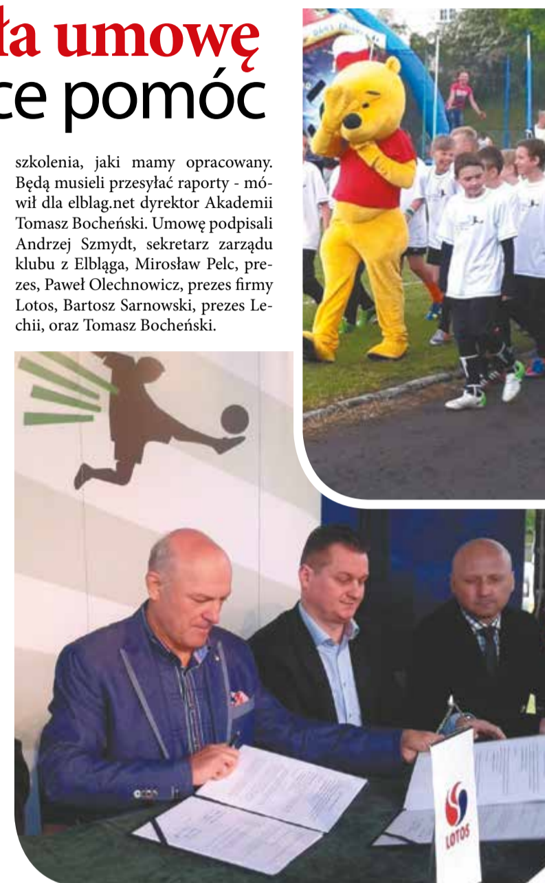
Concordia podpisała umowę z Lechią

rowany głównie do najmłodszych. Dzieci mogły korzystać z przeróżnych zabaw, gier oraz atrakcji takich jak malowanie twarzy. Marszałek wręczył nagrody dla najlepszych szkół w konkursie wiedzy o Unii Europejskiej. Na boisku, przy głównej scenie odbył się mecz trenujących w Concordii dzieci. Wśród obiektywów kamer przewijali się posłowie i kandydujący do Parlamentu Europejskiego politycy, jak np. startujący z listy Platformy Obywatelskiej były siatkarz, poseł Paweł Papke. Wręczył trenującym dzieciom zaproszenia na Mistrzostwa Świata w tej dyscyplinie, jakie odbędą się w tym roku w naszym kraju. Jednym z głównych akcentów było podpisanie umowy pomiędzy Lechią Gdańsk i Concordią Elbląg. - W Elblągu odbywać się będzie szkolenie w 4 grupach wiekowych 2002, 2003, 2004, 2005. Zawodnicy dostaną potrzebny sprzęt, to znaczy dresy, piłki, elementy do treningu jak pacholki, będą stypendia dla najbardziej utalentowanych oraz socjalne dla potrzebujących. Na dodatek miejscowi trenerzy oraz ci, którzy przyjadą, by pomagać w szkoleniu, będą mogli wziąć udział w szkoleniach, jak te np. niedawne w Warszawie. Odbywać się nawet z udziałem zagranicznych szkoleniowców. To będzie opłacane przez nasz klub. Zostaną przeszkoleni w sposobie prowadzenia zajęć, zapoznają się z naszym systemem