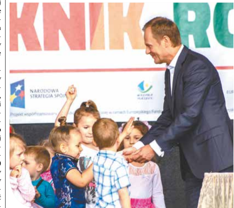
Piknik europejski z premierem Donaldem Tuskiem

mamy prawo powiedzieć - podobnie jak w Gdańsku, Słupsku, na Śląsku, w Lubuskiem, na Zachodnim Pomorzu, na całej Warmii i Mazurach, że my tutaj Europę budowaliśmy od pierwszych dni po wojnie - powiedział szef rządu. Jak dodał, to właśnie w takich miastach, jak Elbląg i setkach innych polskich miejscowości, „Niemcy kiedyś budowali, żeby zniszczyć, Rosjanie przyszli, żeby zniszczyć bez budowania”. - Dopiero Polacy po 1945 roku - mimo, że wcale nie byliśmy pewni, ile tego dziedzictwa, jakie przyniosła nam historia, jest nasze, a ile (jest) dziedzictwa innych narodów, ale nie zastanawialiśmy się, tylko odbudowaliśmy te miasta, wiedząc, że to jest być może najważniejsze zobowiązanie wobec tej ziemi, całej Europy - zaznaczył premier. Tusk powiedział też, że kiedy patrzy na polskie miasta, wielki polski wysiłek, to może z dumą powiedzieć, że „my tę Europę tutaj budujemy od dziesięć lat”.