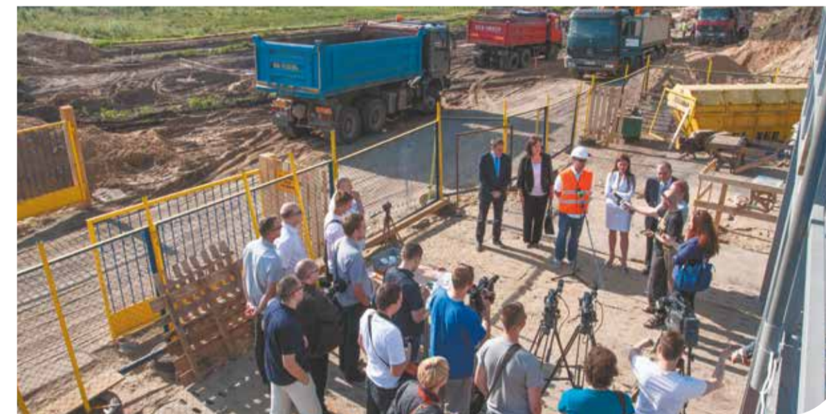
Turbinalia 2014 w Elblągu

Ceny biletów mają oscylować w granicy 7 złotych i dochód z tego tytułu będzie wyłącznie przeznaczony na utrzymanie i konserwację obiektu. W ramach budowy zostanie również wyremontowana ul. Moniuszki. Niestety, w planach projektu nie ma słowa o jakichkolwiek działaniach na basenie odkrytym. Na to będziemy musieli jeszcze poczekać. Aktualne prace budowlane to dopiero pierwszy etap. Projektanci przygotowali się na późniejszą rozbudowę obiektu, jeżeli tylko znajdą się na to kolejne środki. Jakakolwiek rozbudowa w latach późniejszych w żadnym stopniu nie wpłynie na funkcjonowanie już oddanych części kompleksu.