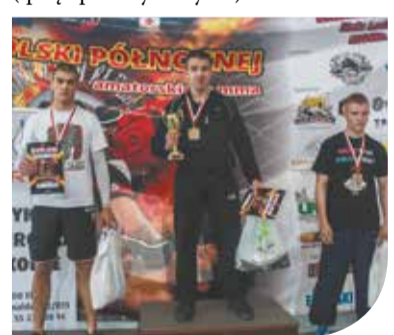
Puchar amatorskiego MMA w Elblągu

Mastalerz trener w Fight Club Elbląg. - Dla zawodników organizatorzy zapewniają okazjonalne medale (777 lat miasta Elbląg), dyplomy, za pierwsze miejsca puchary. Dodatkowo wartościowe nagrody od sponsorów (sprzęt sportowy i odżywki).