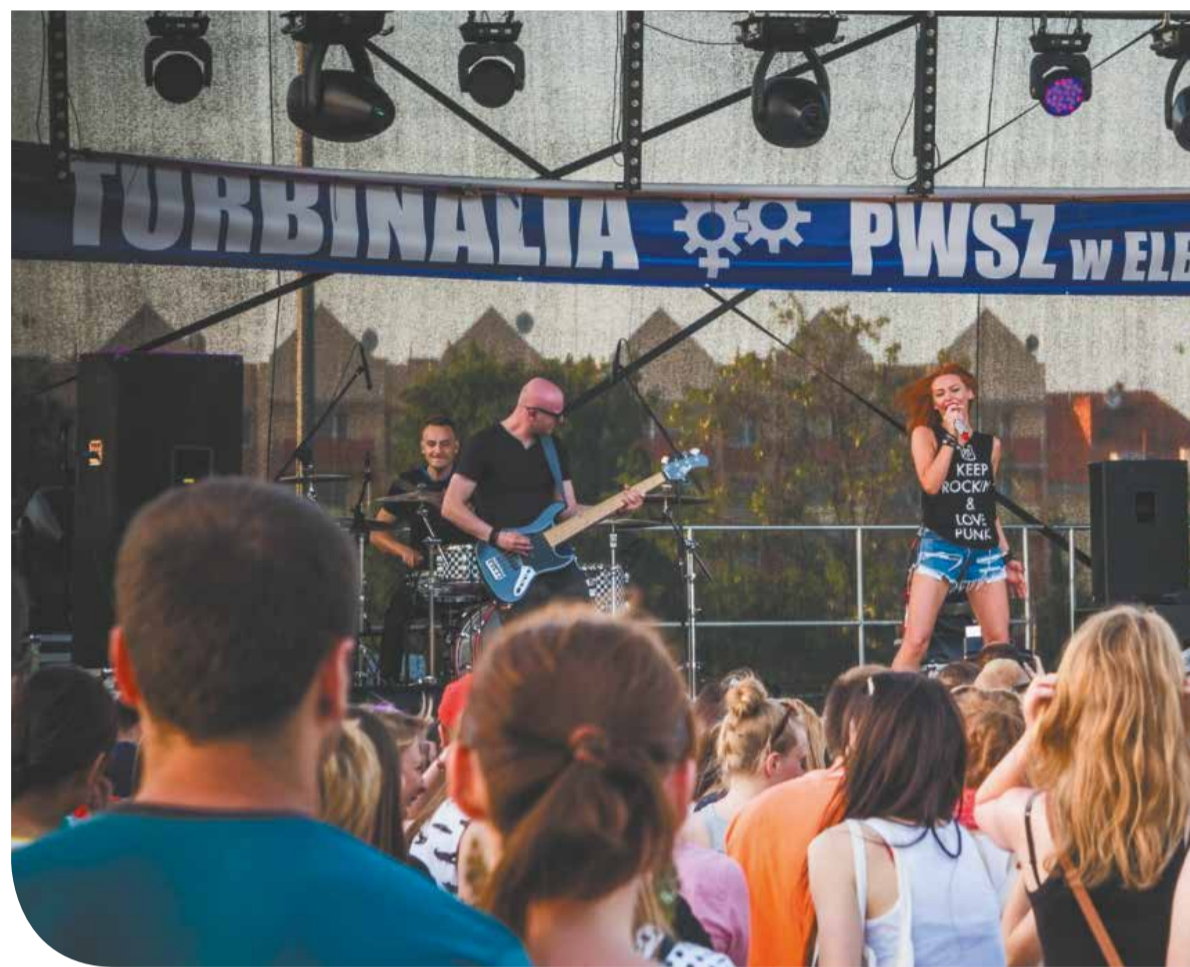
Turbinalia 2014 w Elblągu fotografie: Bartłomiej Rys. Fotografie z przemarszu www.wawro.com