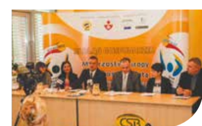
Konferencja dot. MSNS

Już 14 czerwca rozpoczyna się Mistrzostwa Świata w Piłce Siatkowej Na Siedząco Kobiet i Mężczyzn. Tego dnia odbędzie się na Starym Mieście o godzinie 17.00 prezentacja uczestniczących w turnieju zespołów. Przyjedzie około 600 gości z całego świata. Organizatorzy liczą, że będą wszystkie awizowane drużyny bo to pomoże w kosztach imprezy. Do współpracy zgłosiło się 170 wolontariuszy. Będą odpowiadać, za przeróżne aspekty związane z reprezentacjami, kibicami, informacją. W ramach promocji zagraniczni goście mają zwiedzić okoliczne miasta Malbork, Frombork, Gdańsk. Inauguracja turnieju 15 czerw-