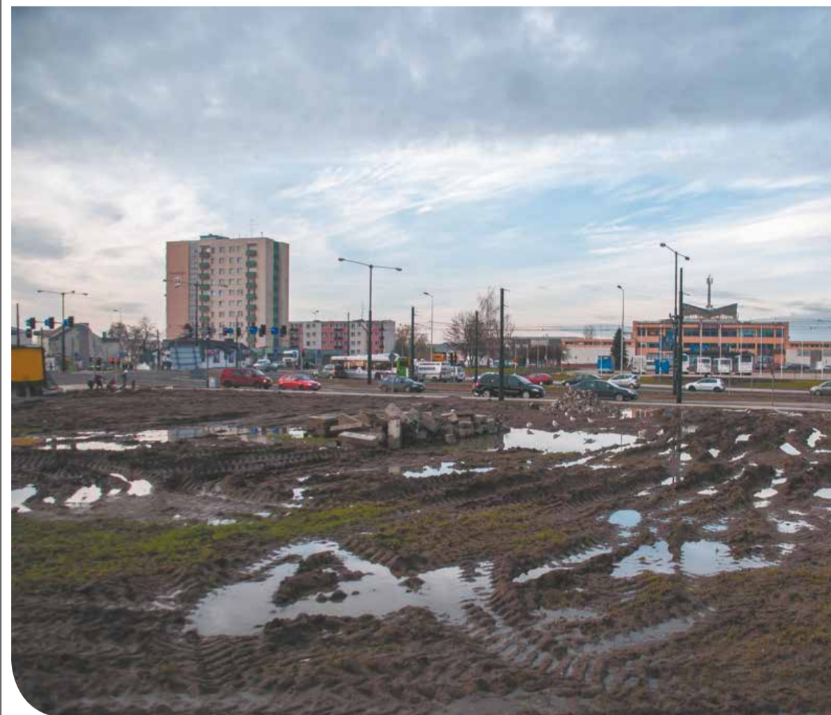
Działka pod planowaną Galerię Porto

W Elblągu jest wiele opuszczonych działek. Wiele w dogodnych lokalizacjach. Właściciele tych terenów powinni płacić miastu należności, których nie ma. Inwestycje również się nie rozpoczęły i raczej nie rozpoczną. Hotel Ibis oraz Porto 55 pozostają na razie tylko na papierze.