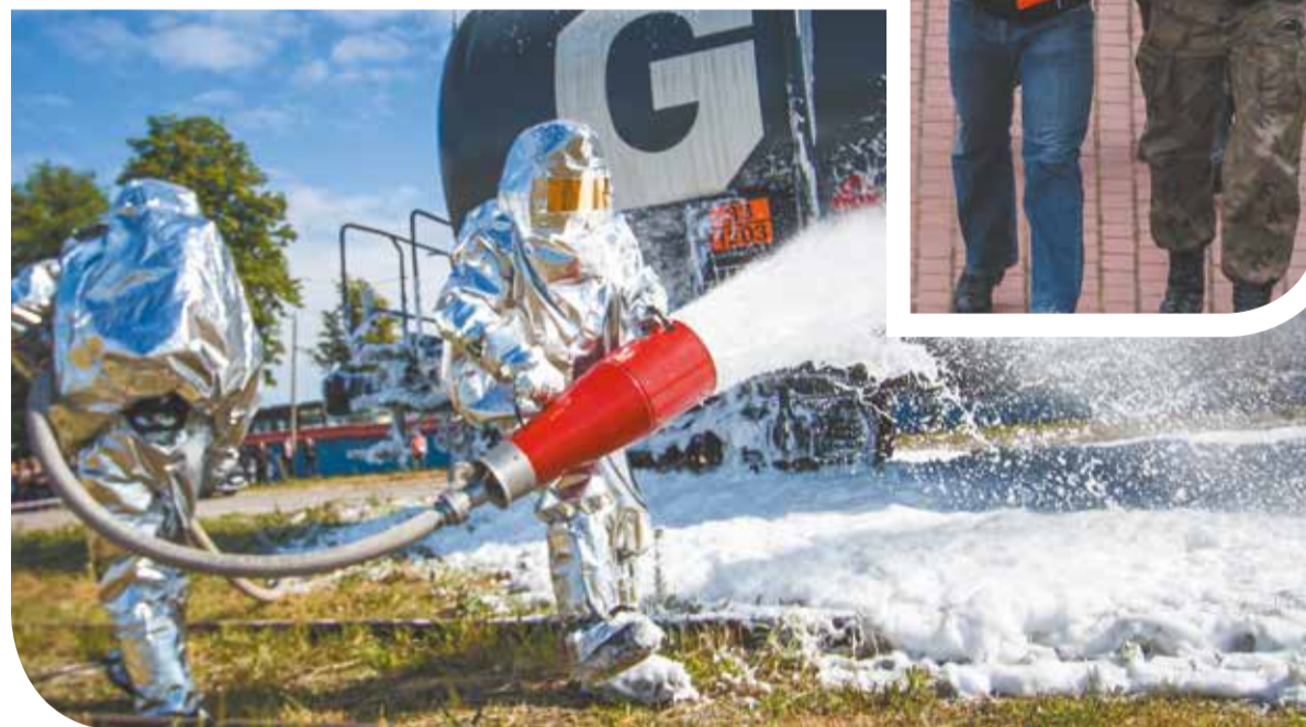
Ćwiczenia na wypadek wojny lub ataku terrorystycznego w Elblągu, 2014