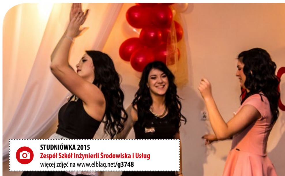
STUDNIÓWKA 2015 Zespół Szkół Inżynierii Środowiska i Usług więcej zdjęć na www.elblag.net/g3748