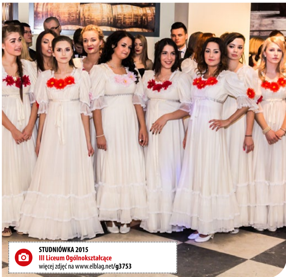
STUDNIÓWKA 2015 III Liceum Ogólnokształcące więcej zdjęć na www.elblag.net/g3753