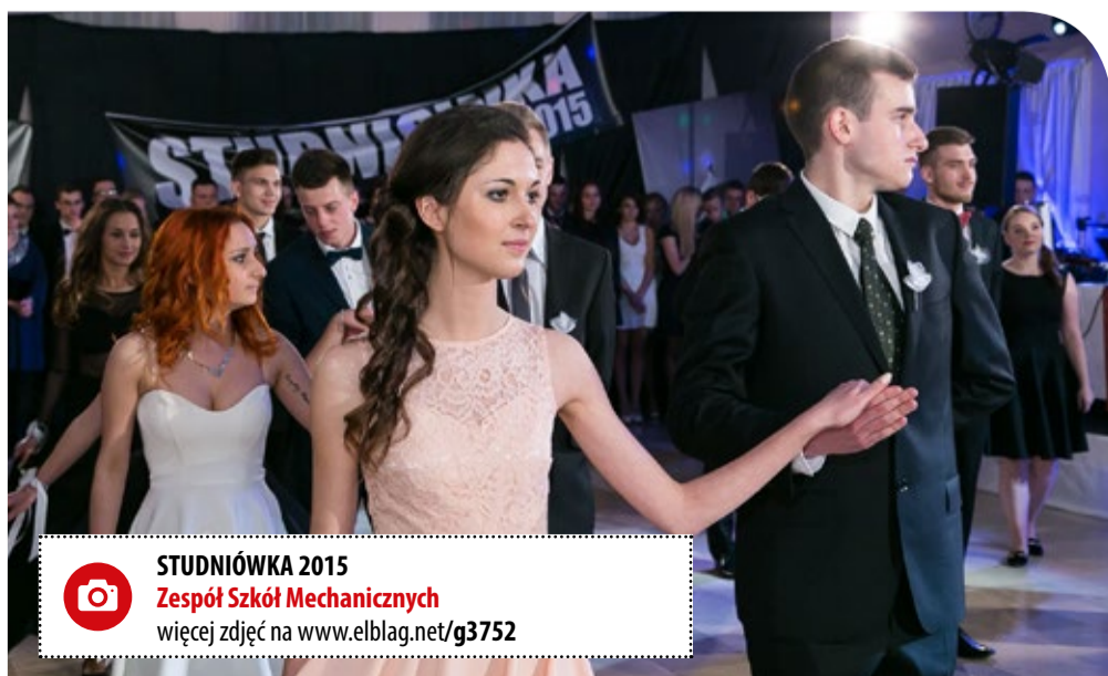
STUDNIÓWKA 2015 Zespół Szkół Mechanicznych więcej zdjęć na www.elblag.net/g3752