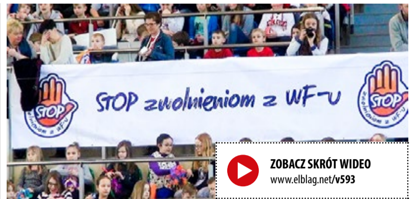
ZOBACZ SKRÓT WIDEO www.elblag.net/v593