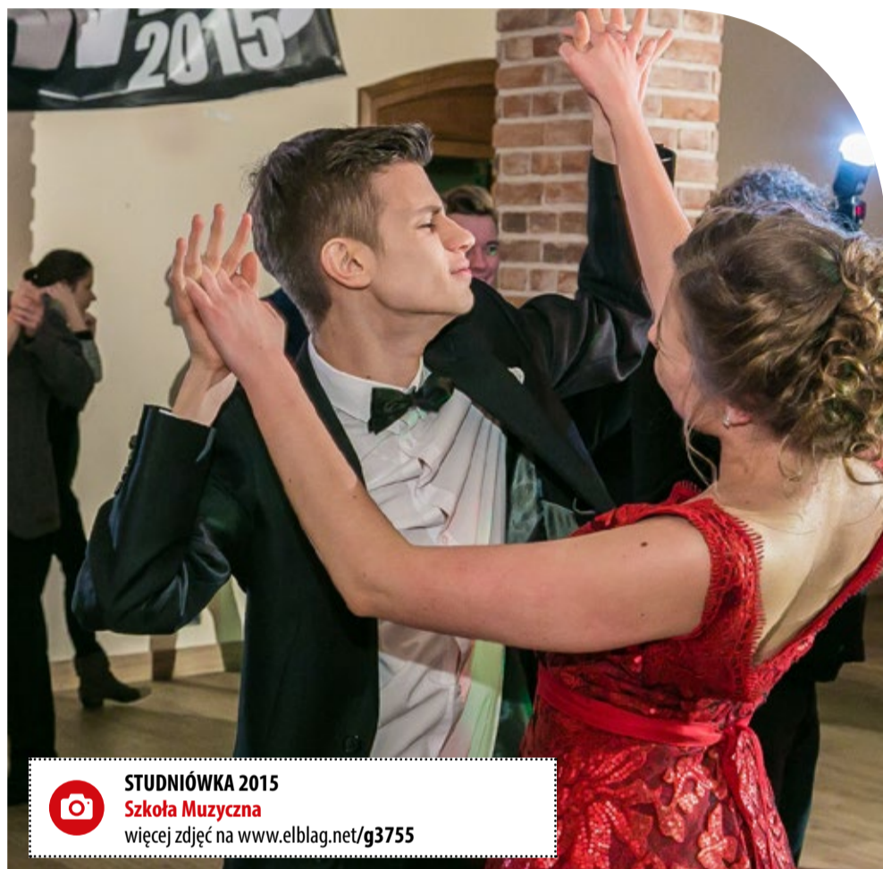
STUDNIÓWKA 2015 Szkoła Muzyczna więcej zdjęć na www.elblag.net/g3755