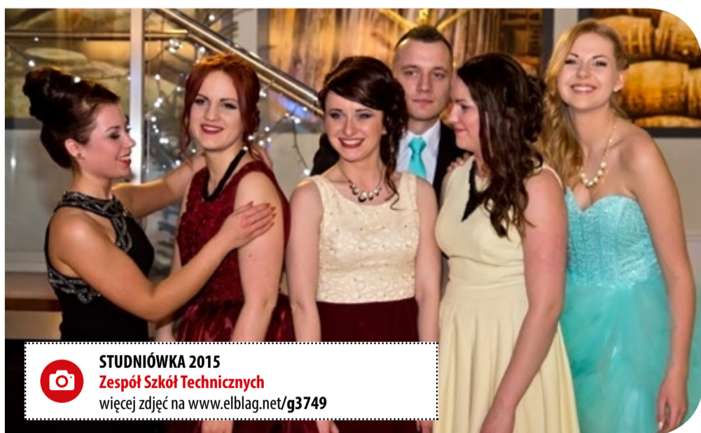
STUDNIÓWKA 2015 Zespół Szkół Technicznych więcej zdjęć na www.elblag.net/g3749