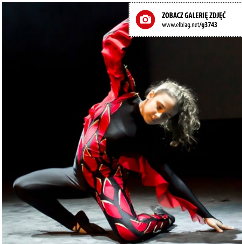
ZOBACZ GALERIĘ ZDJĘĆ www.elblag.net/g3743